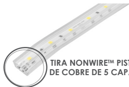
TIRA NONWIRE™ PISTA DE COBRE DE 5 CAPAS