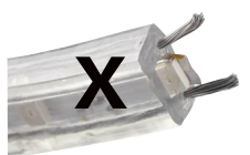
Manguera convencional wire