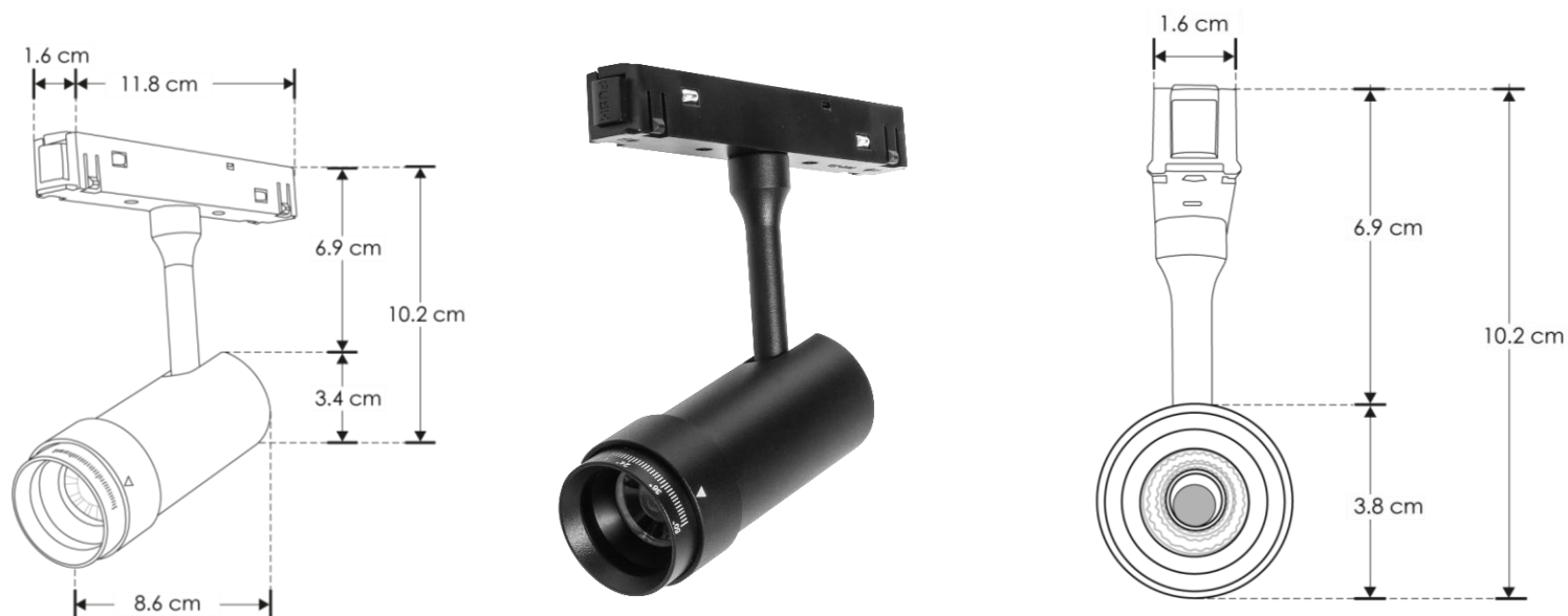
Luminario para riel magnético con lente de enfoque de 15 a 50°

NOTA: LAS CARACTERÍSTICAS TÉCNICAS Y ELÉCTRICAS FAVOR DE CONSULTAR EN LA ETIQUETA DE PRODUCTO