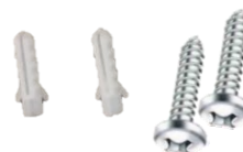
Juego de dos taquetes y dos pijas