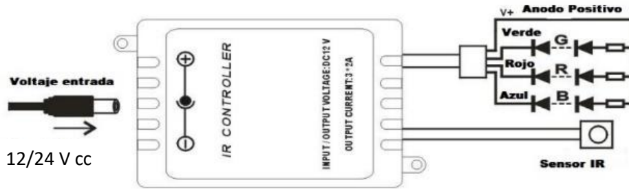
Diagrama de conexiones