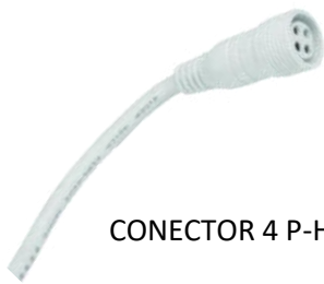
CONECTOR 4 P-H