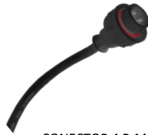
CONECTOR 4 P-M

Utilizado para conectar luminarios LED RGB de bajo voltaje a fuentes de poder o controladores. Grado de protección IP20 (para uso en interiores).